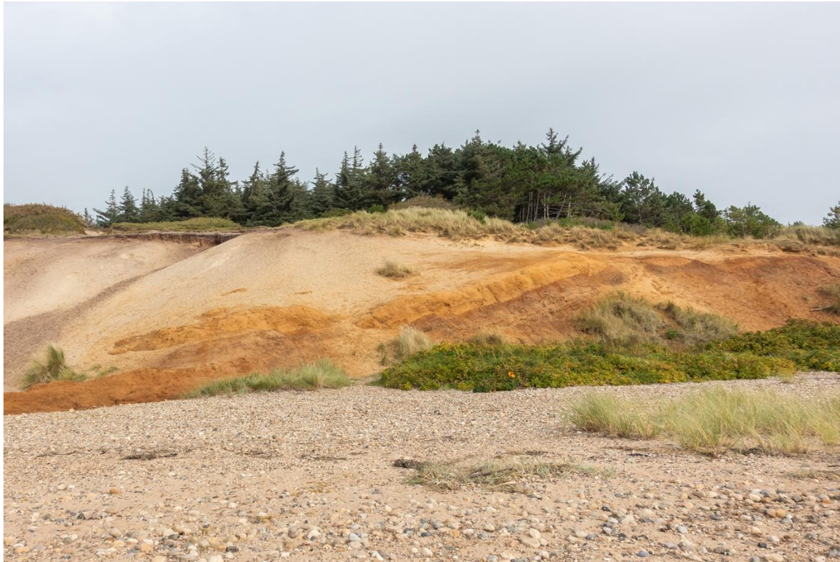
Gule Bjerg.