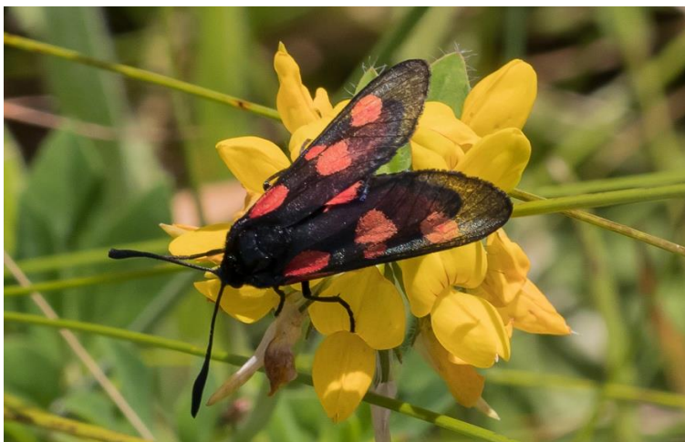
Køllesværmer på Kællingetand i Marbækområdet.