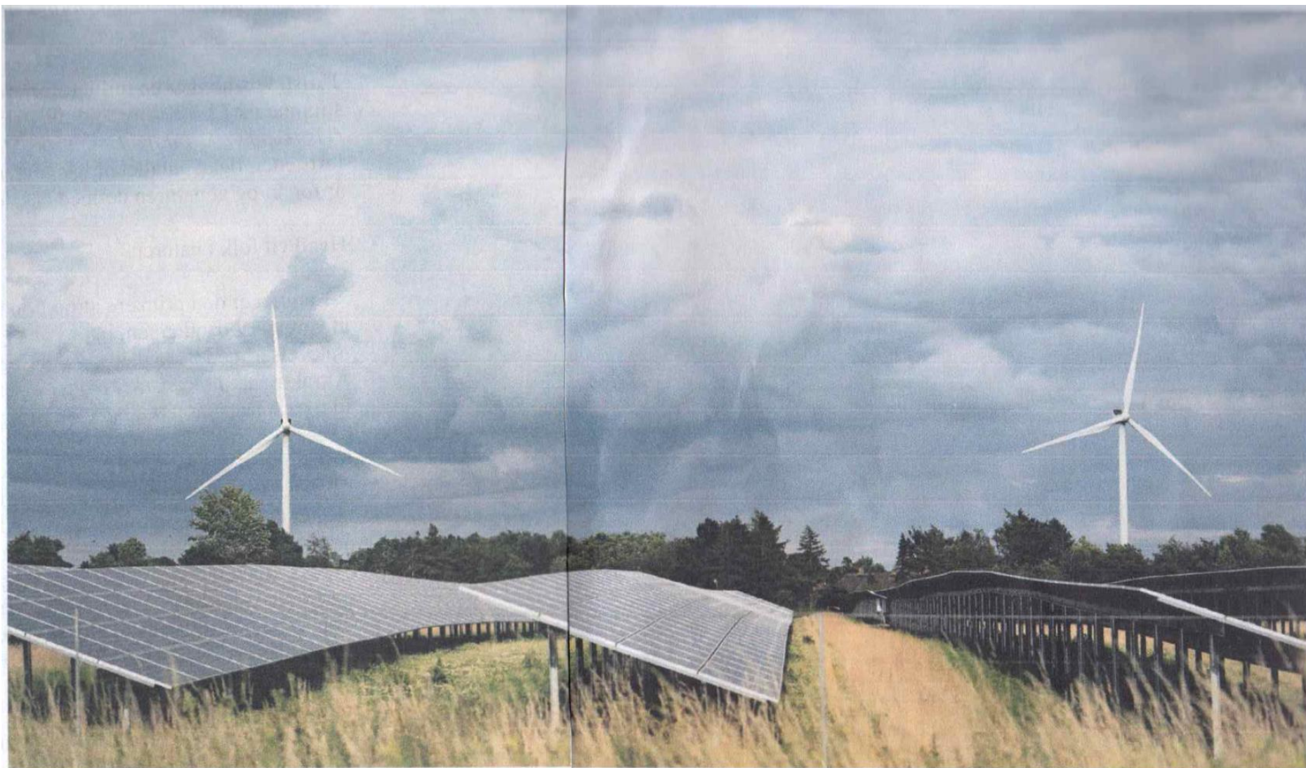
Energipark langs Sydmotorvejen E47.