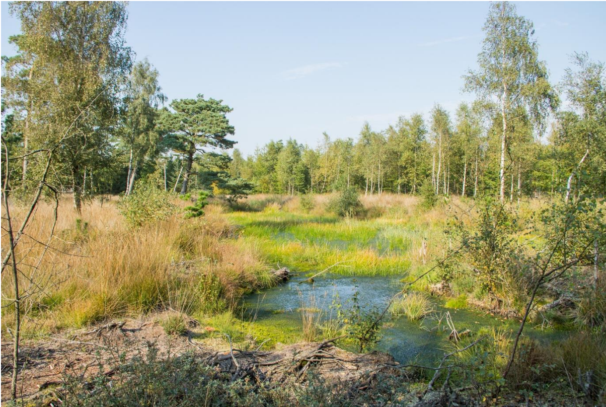
Hubertussøen ved Marbæk Tømmervej.