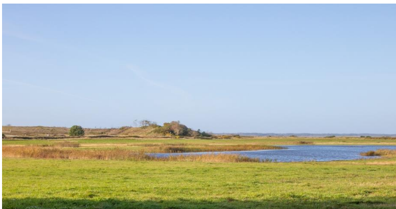
Strandengen ved Myrthuegård.