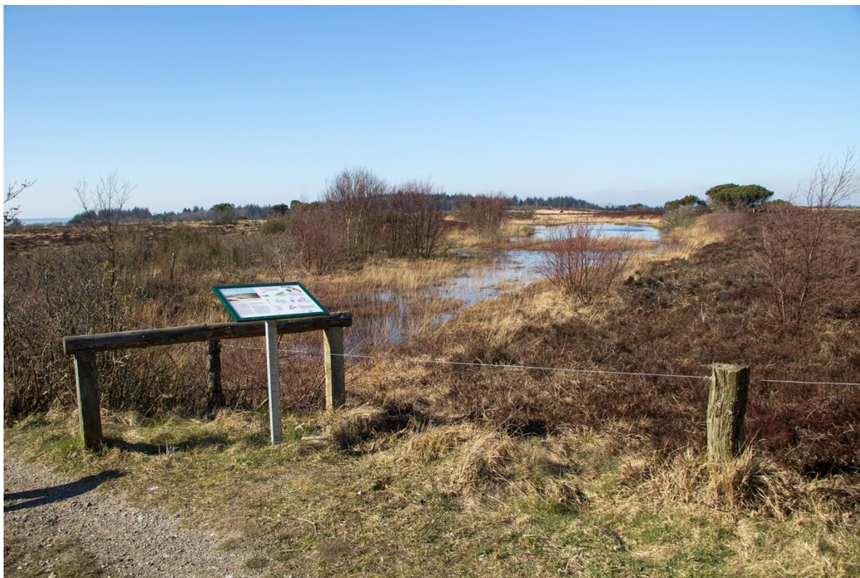
Salamandersøen ved Skelstien.